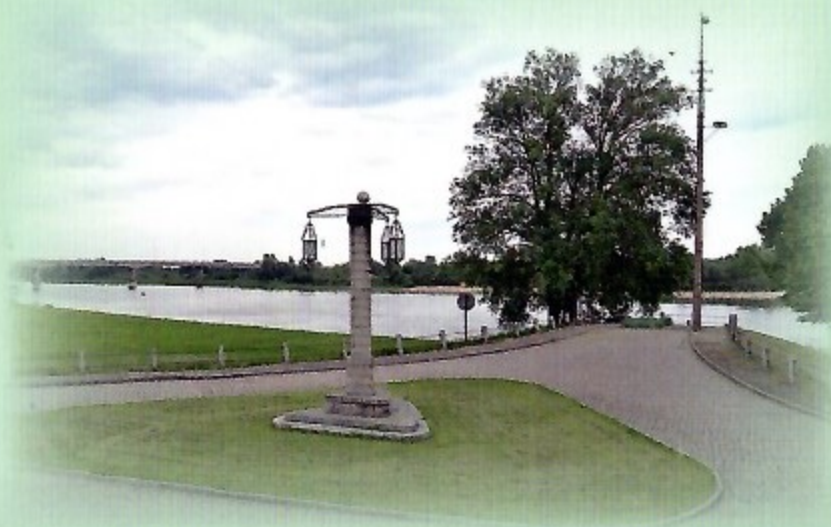
Vaizdas į Atmatą

Paminklas Mahatma Gandžiui ir Hermanui Kalenbachui – 2015 m. Rusnėje, Atmatos krantinėje, atidengtas paminklas Indijos tautos tėvui Mahatma Gandžiui ir jo bendražygiui, Rusnės sūnui Hermanui Kalenbachui.