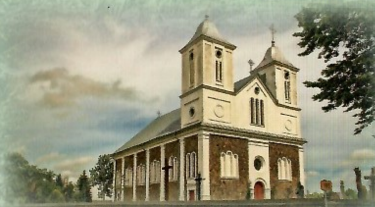
Vainuto Šv. Jono krikštytojo bažnyčia