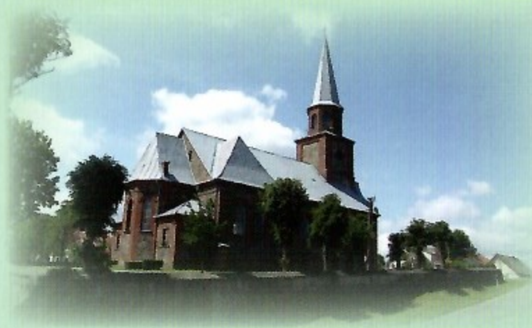
Gardamo Šv. Roko bažnyčia

Saugų lentpjūvė – iki šių dienų išlikęs raudonų plytų mūro vandens malūnas, statytas 1908 metais, kuriame buvo malami grūdai, apdorojama mediena. Senieji mechanizmai išlikę, dabar malūne veikia lentpjūvė.