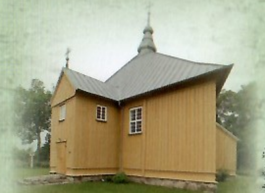
Šv. Vincento Ferero bažnyčia