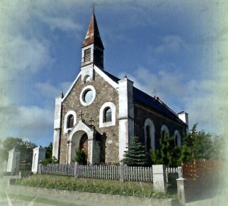
Evangelikų liuteronų bažnyčia

Vilkėno dvaras – dvaro ansamblis kurtas 1880-1897 m. Vilkėno dvaro rūmai yra neorenesansinis dviejų aukštų nesudėtingo simetriško plano statinys su bokštu. Pagrindiniame fasade keturių mūrinių kolonų portikas, galiniame fasade – balkonas. 2007 metais restauruota Vilkėno dvaro rūmų išorė. Dvaro rūmus supa 13 ha parkas.