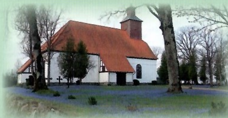
Katyčių evangelikų liuteronų bažnyčia