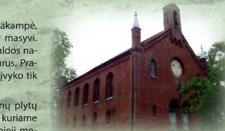
Saugų evangelikų liuteronų bažnyčia