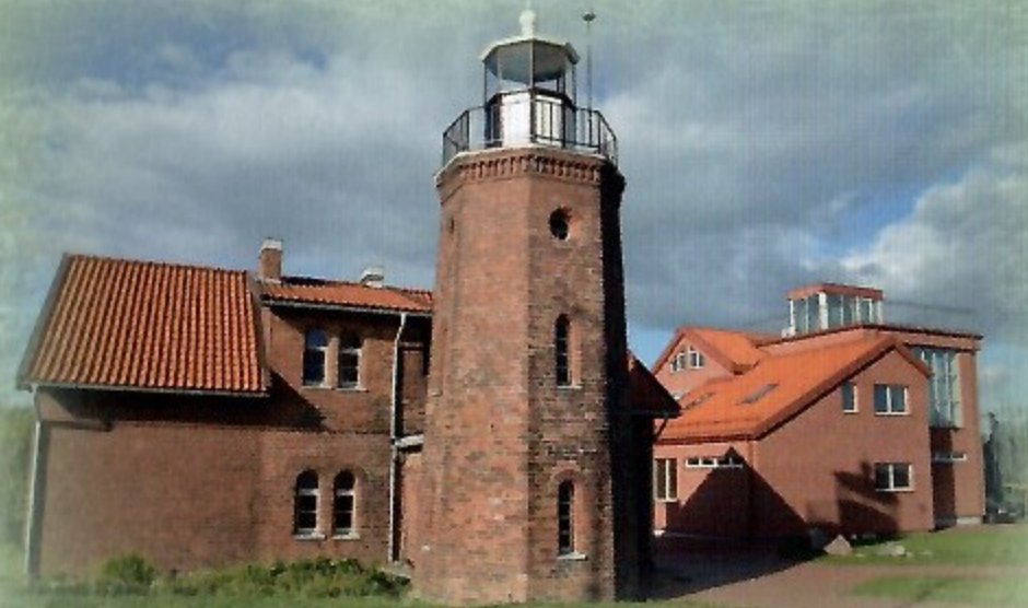
Ventės rago ornitologinė stotis

Ventės ragas – nuostabus vakarų Lietuvos kampelis Kuršių marių pakrantėje. Ši vieta apipinta legendomis ir tikrais įvykiais, menančiais kryžiuočių laikų pilį ir ne kartą dužusius laivus. Dabar Ventės ragas – labiausiai turistų lankoma vieta Pamaryje, kur galite rasti ramybės oazę ant marių bangų sklaujamo kranto. Pro Ventės ragą eina vienas didžiausių migracijos kelių „Via Baltica“, čia veikia viena seniausių Europos ornitologinių stočių. Gamtos mylėtojams svarbi spalio pradžia – tai metas, kai migruojantys paukščiai traukia į pietus, tūkstančius jų galima palydėti užlipus į daugiau kaip prieš pusantro šimto metų pastatyto Ventės rago švyturio apžvalgos aikštelę, kur esant giedram dangui ne tik atsiveria nuostabūs marių horizontai su išskrendančiais sparnuočiais, bet ir pamatyti kitame krante stūksančias auksines Neringos kopas. Stotyje veikia muziejus, kuriame galima susipažinti su paukščių žiedavimo istorija, paukščių migravimo tyrimais ir turtingu šių apylinkių sparnuočių pasauliu.