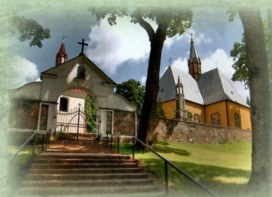
Šv. Arkangelo Mykolo bažnyčia

Senas Žemaitijos pasienio miestelis, kurio apylinkėse gyventa nuo XIV a. Ypatingą reikšmę miestelis įgavo po 1863-1864 m. sukilimo uždraudus lietuvišką spaudą, jis tapo svarbiu draudžiamos literatūros platinimo punktu. Per jį ėjo vienas svarbiausių knygnešių kelių. Akmenimis grįsta, nuo XIX a. pr. mažai pakitusi senoji Žemaičių Naumiesčio turgaus aikštė taip pat mena apie daugiakultūrinį paribio miestelio gyvenimą. Čia stovintys namai kaip gyvi eksponatai primena juose veikusias žydų, lietuvių, lietuvininkų parduotuves, smukles, dirbtuvėles. Spėjama, kad netoli Žemaičių Naumiesčio gimė ir užaugo pirmosios lietuviškos knygos autorius Martynas Mažvydas. Jam pastatytas paminklinis akmuo. Miestelio architektūra, nepasikeitusi per daugelį metų, vilioja lietuviškų filmų statytojus.