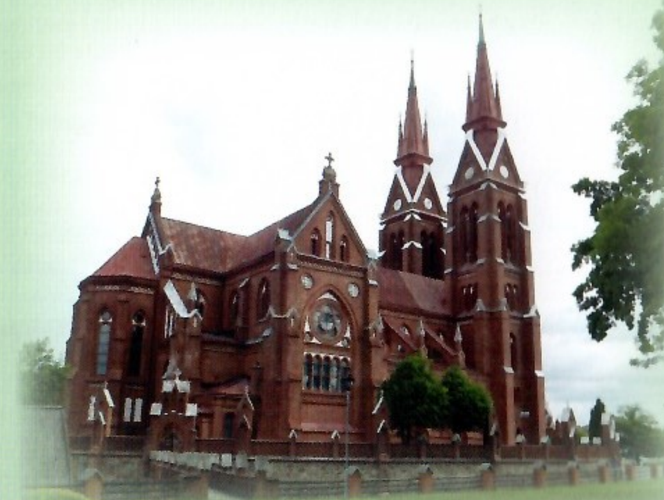
Šv. Apaštalo Jokūbo bažnyčia