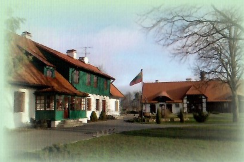
Kintų Vydūno kultūros centras

Muižės kaimo kapinės – kapinėse palaidotas Vėtrungių įkūrėjas E. V. Berbomas.