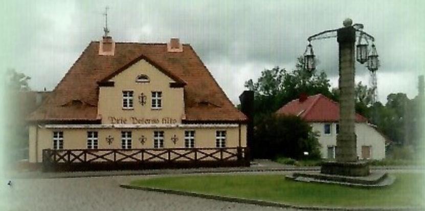
Vila prie Peterso tilto