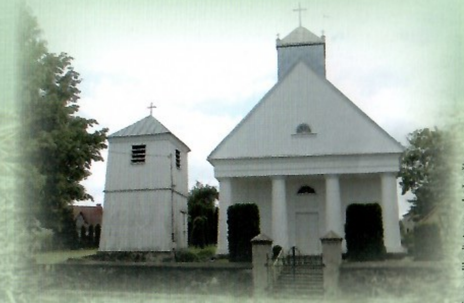
Evangelikų liuteronų bažnyčia